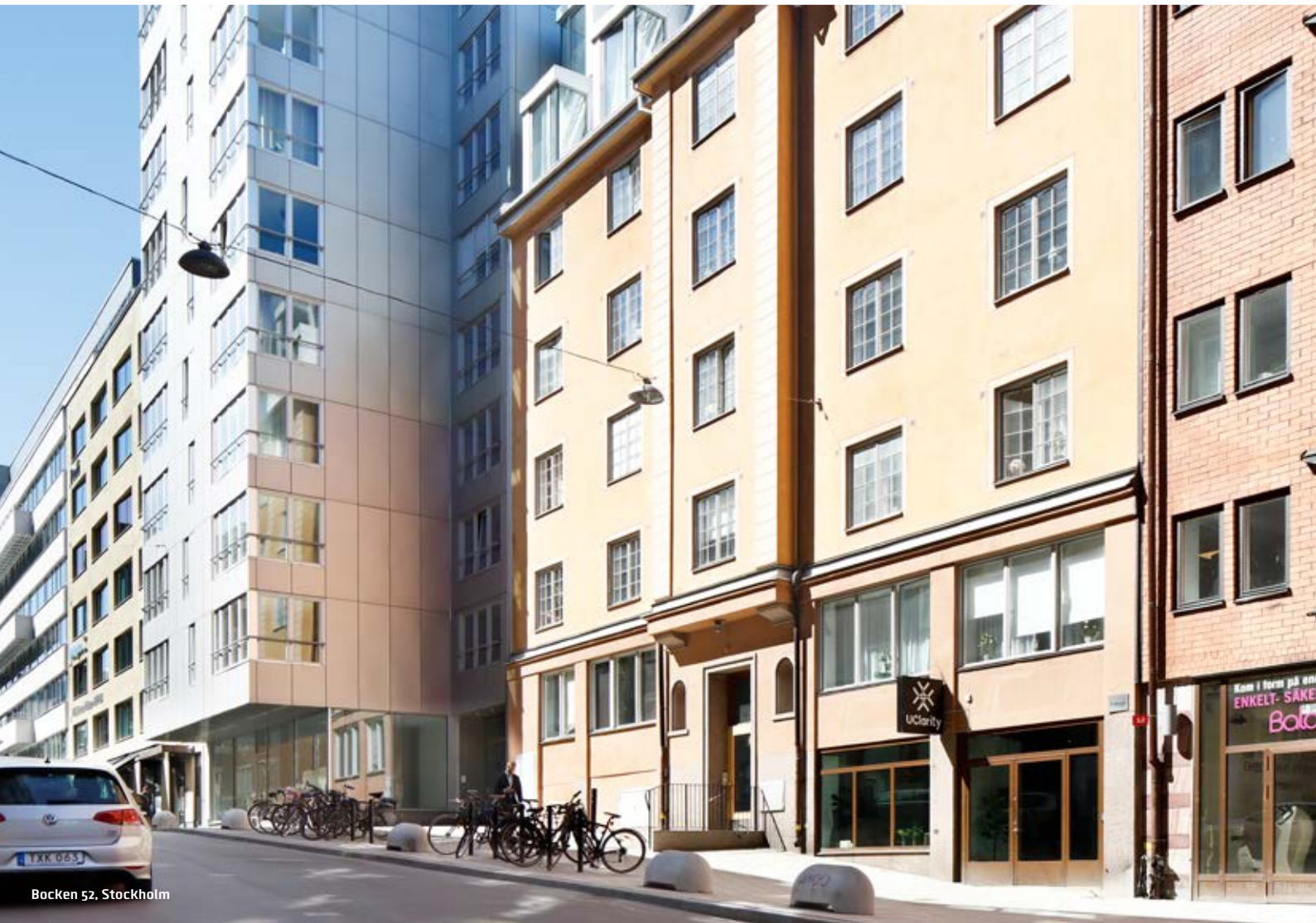
Bocken 52, Stockholm