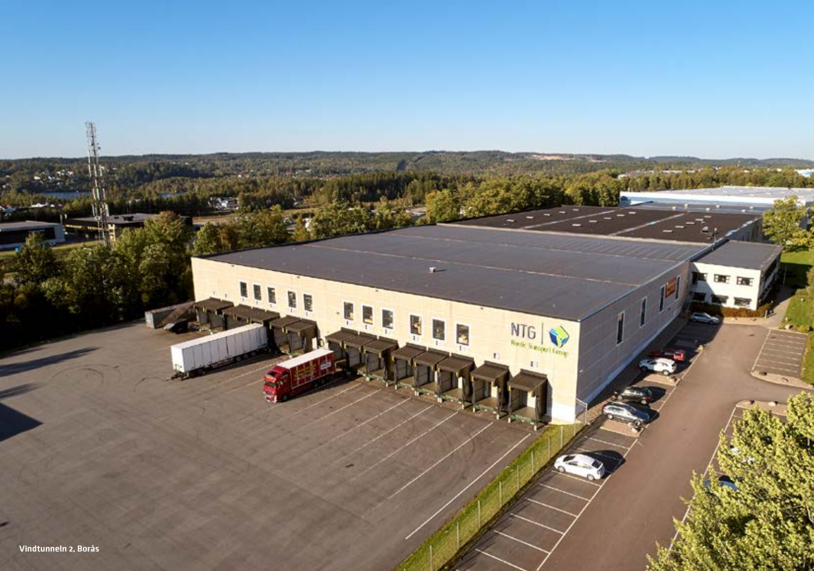
Vindtunneln 2, Borås