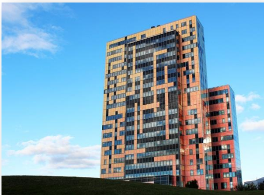
Fastigheten Syret 3 (Ideon Gateway)

Wihlborgs miljöarbete bygger på aktiva val av energislag mot förnybara källor. Tillsammans med ständiga förbättringar i nom energieffektivisering säkerställs minskade klimatutsläpp från fastighetsbeståndet. All nyproduktion av fastigheter miljöcertifieras och den svenska miljöstandard Miljöbyggnad (nivå guld) är förstahandsvalet vid certifiering. Wihlborgs arbetar för gröna hyresavtal i affärsrelationen med sina kunder. Därmed skapas en plattform för samverkan mellan hyresvärd och hyresgäst inom bl.a. energi, inomhusmiljö och materialval.